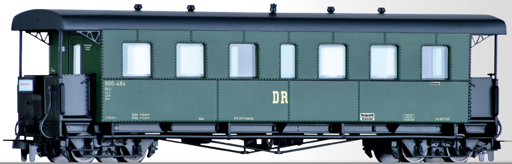
Personenwagenset der DR, bestehend aus zwei Personenwagen KB4i Passenger coach set of the DR with two passenger coaches KB4i