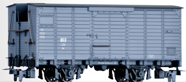
Gedeckter Güterwagen Gw der NKB Box car Gw of the NKB