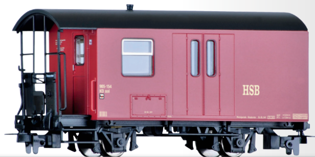
Packwagen KDaai der HSB Baggage car KDaai of the HSB